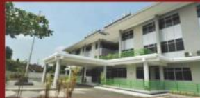
Kampus STIKES A.Yani