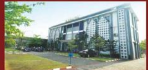
Kampus STIKES Alma Ata