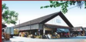
Pasar Buah Induk "Gemah Ripah"