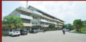
RS.PKU Muhammadiyah Yogyakarta