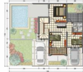
Denah lantai 2