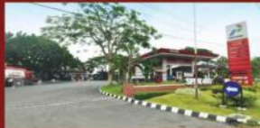
SPBU Gamping & Ambarketawang