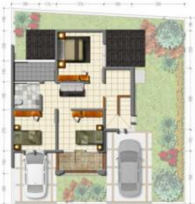
Denah Lantai 2