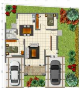
Denah Lantai 1 Tipe 110