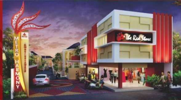
Gate 2 & Ruko