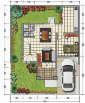
DENAH LANTAI 1