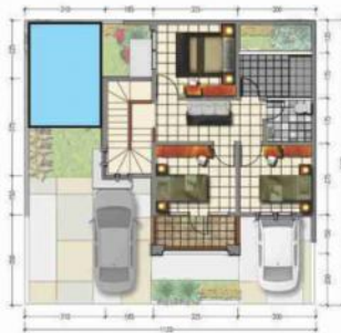
DENAH LANTAI 2