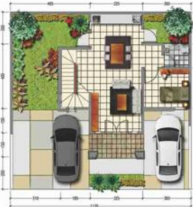
DENAH LANTAI 1