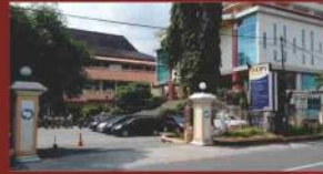
Pusat Kuliner Soto Kadipiro