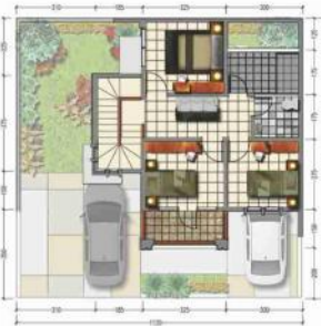
DENAH LANTAI 2