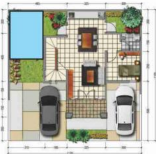
DENAH LANTAI 1