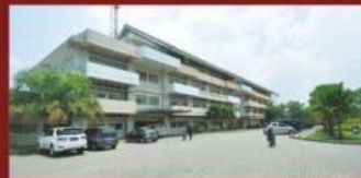
RS.PKU Muhammadiyah Yogyakarta