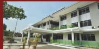
Kampus STIKES A.Yani