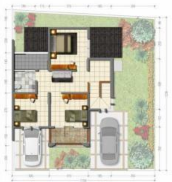
Denah Lantai 2