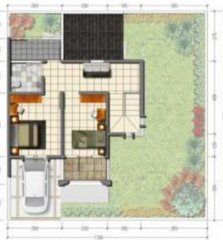
Denah Lantai 2