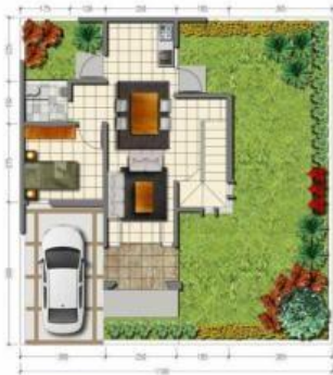
Denah Lantai 1 Tipe 85