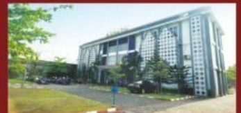
Kampus STIKES Alma Ata