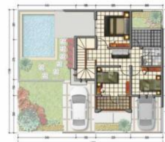
Denah lantai 2