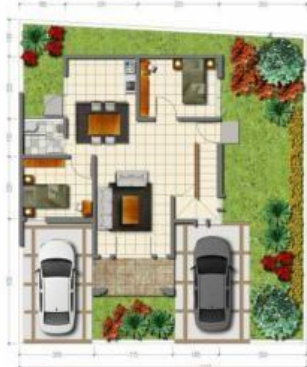
Denah Lantai 1 Tipe 110