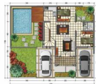
Denah lantai 1