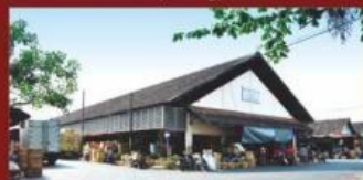
Pasar Buah Induk "Gemah Ripah"