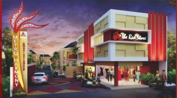
Gate 2 & Ruko