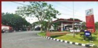
SPBU Gamping & Ambarketawang